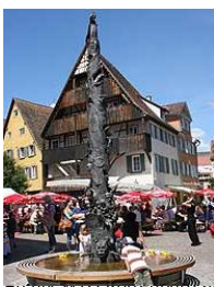
Stadtkulturamt Stadt Rottenburg Ulrich Wagner, Rottenburg Archiv WITG Rottenburg am Neckar mbH

Фонтан шутов (участники карнавала) мастера Герольда Еггле был открыт в 2009 г.. Колонна высотой более 5 метров изображает фигуры и обычаи карнавала в Роттенбурге - Фаснэт. Основу фонтана составляют четыре главные маски: Аланд, Помпеле, Хексэ (ведьма) и Лауфнарр (придворный шут). Передача городского ключа, фанфарный ход, мытьё кошелька, уличный карнавал, встречи шутов и башни Роттенбурга - это всё представлено на этой колонне. На верхушке сидит на троне Графиня Мехтильд, покровительница роттенбургского карнавала, которая в 1452 г. провела впервые "Фаснахтэн" - карнавальную ночь.